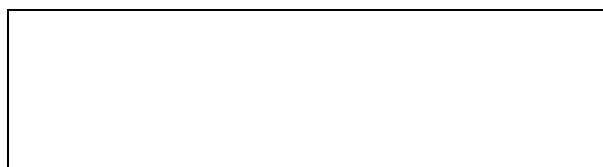
Схема границы балансовой принадлежности тепловых сетей

Прочие сведения по установлению границ раздела балансовой принадлежности тепловых сетей _____ _____